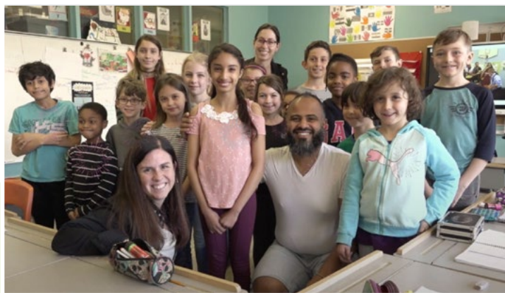
Des élèves et leurs enseignants qui participent au projet Intégrons, travaillons et décroisonnons « R-Com »