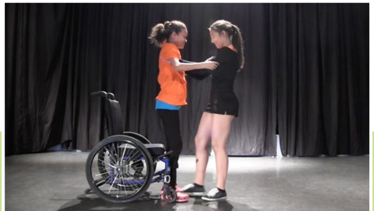
Des élèves athlètes de l'école internationale du Phare